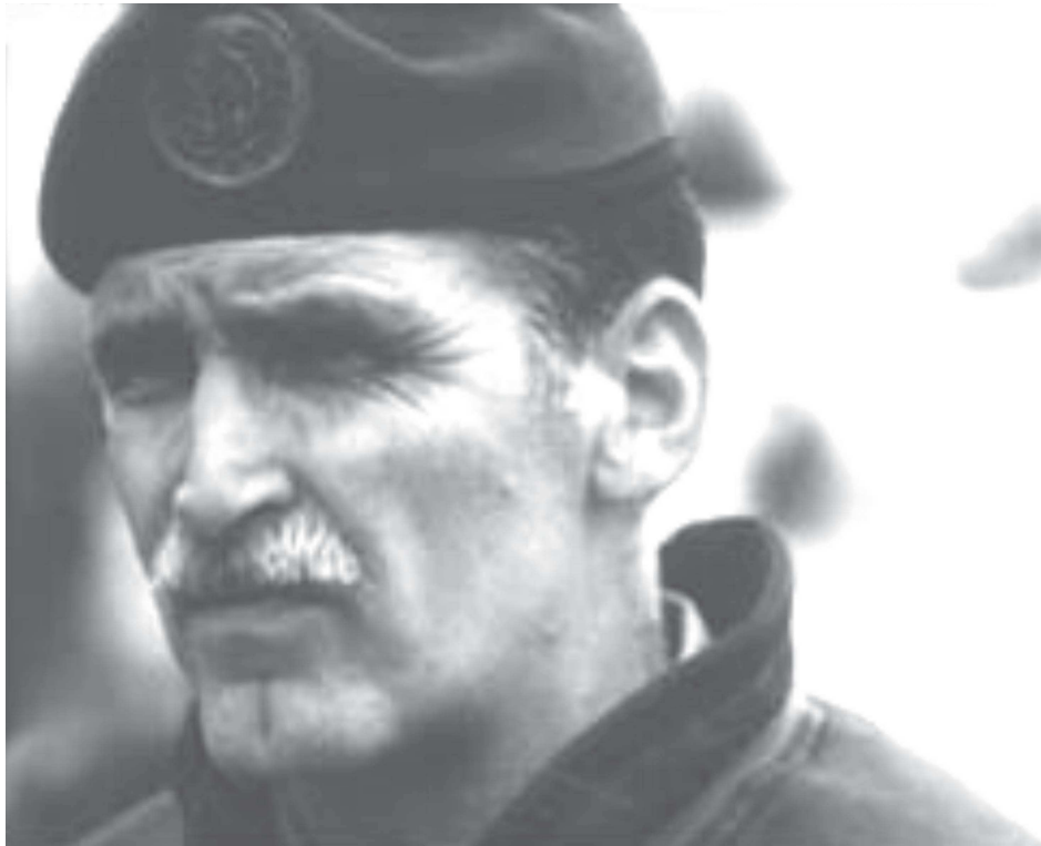
Figure A-5 Roméo Dallaire