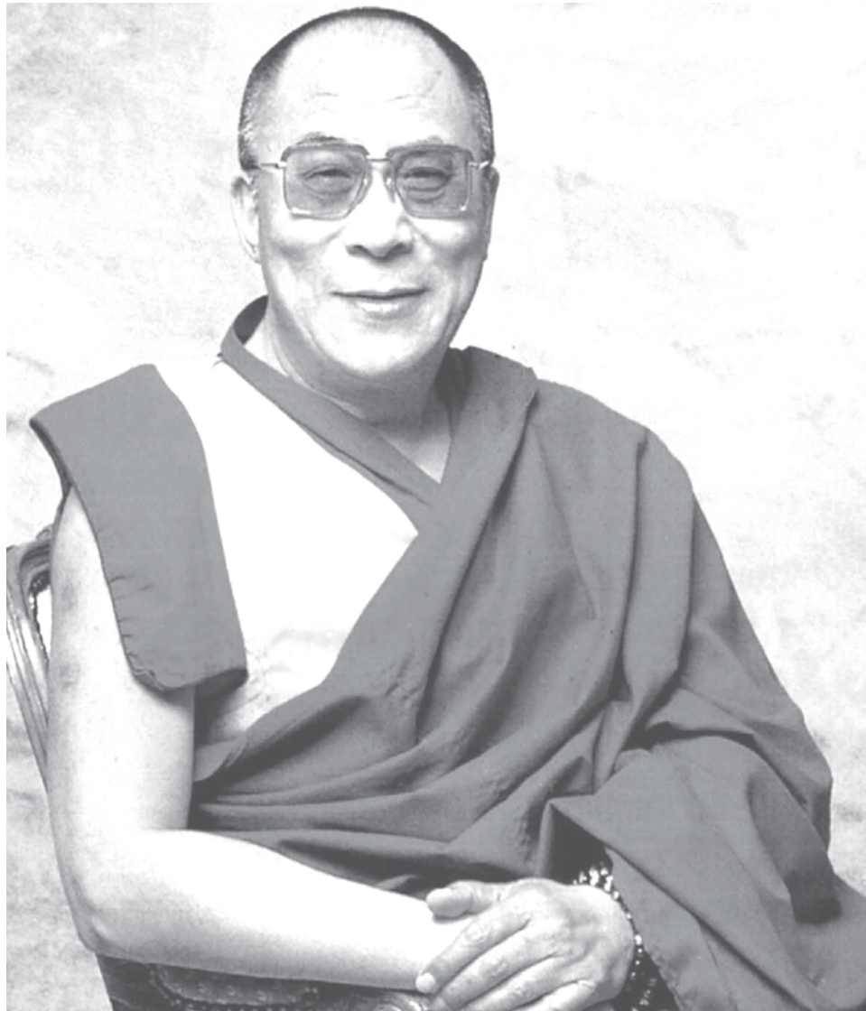
Figure A-3 Tenzin Gyatso (14 e Dalaï Lama)

Remarque. Tiré de The Nobel Prize. The Nobel Peace Prize 1989 (2012). Extrait le 1 er mars 2012 du site http://www.nobelprize.org/nobel_prizes/peace/laureates/1989/