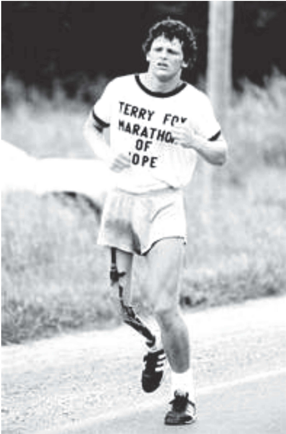
Figure A-6 Terry Fox