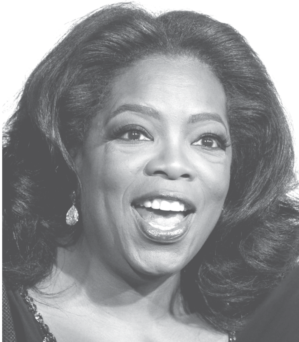
Figure A-7 Oprah Winfrey