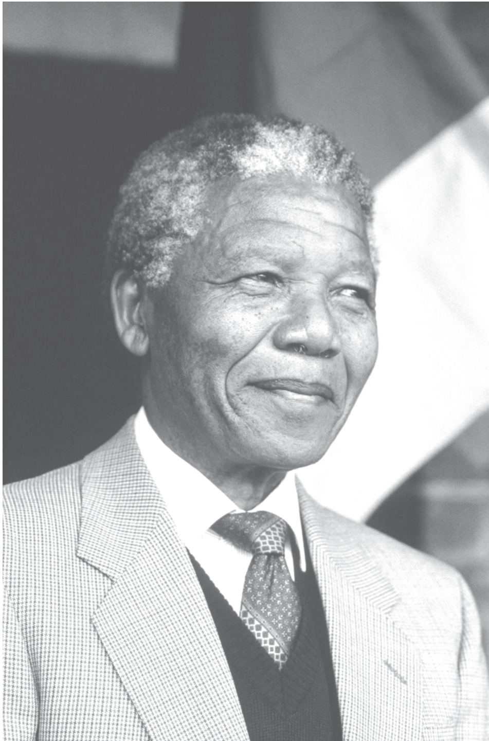
Figure A-1 Nelson Mandela

Remarque. Tiré de The Nobel Prize. The Nobel Peace Prize 1993 (2012). Extrait le 1 er mars 2012 du site http://www.nobelprize.org/nobel_prizes/peace/laureates/1993/