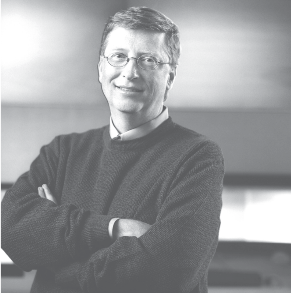
Figure A-4 Bill Gates

Remarque. Tiré de Microsoft. Bill Gates (2012). Extrait le 1 er mars 2012 du site http://www.microsoft.com/presspass/exec/billg/